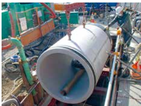
雨水管渠整備工事