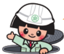
下水道きんたくん