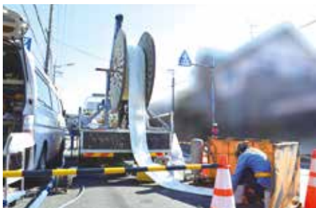
大和団地管渠更生工事