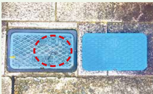
(左)割れたフタ、(右)新しいフタ

水道メーターボックス（プラスチック製のフタを1回無料で交換します。交換を希望される場合は、水道技術課（☎740-1264）へ。