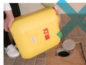
下水道の使用はルールを守って

灯油などを下水道に流すと火災や爆発の恐れがあり、危険です。また、台所での割りばしや野菜くず、風呂場での髪の毛やせっけんの固まりなどは流さずに取り除いてください。紙オムツや生理用品などは下水道管が詰まる原因になりますので、トイレに流さないでください。