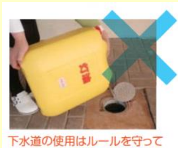
下水道の使用はルールを守って