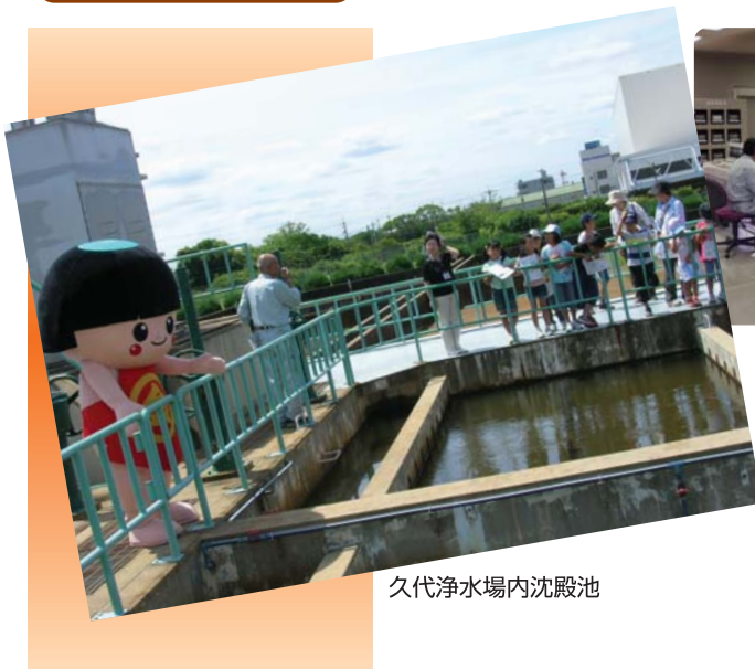
久代浄水場内沈殿池

給水人口……………160,462人 給水世帯数……………66,876世帯 年間配水量……………16,916,811m 3 年間使用水量……………15,950,323m 3